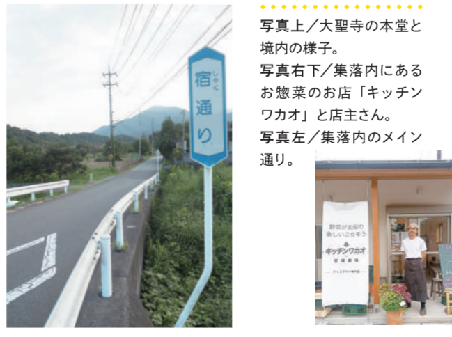
写真上/大聖寺の本堂と境内の様子。写真右下/集落内にあるお惣菜のお店「キッチンワカオ」と店主さん。写真左/集落内のメイン通り。

「八日市場」の名称の由来は、「八」のつく日に、市場が開かれていたこと。市場は、明治の初め頃まで続き、その後途絶えていきましたが、昭和50年代に、地域の同志会によって約百年ぶりに復活。大聖寺の不動尊祭の日に合わせて、寺前の駐車場、農産物や衣類、木工品などが市に並びました。市場は再び幕を開けてしまいましたが、大聖寺のお祭りは現在も続いています。