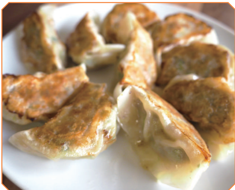
写真上／うまいもん家の身延薬膳ぎょうざ。写真下／ゆば工房五大のゆばまん。

住所山梨県南巨摩郡身延町帯金3705-1 営業月～土 9:00～18:00、日 9:00～12:00 電話0556-62-3535 アクセス下部温泉早川ICより車で約7分