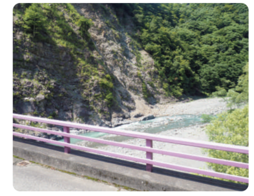
写真右上/望月美佐江さんのお家で話を聞いた時の様子。 写真左上/ゴウヤ畑の前にて美佐江さんと主人の信保さん。 写真左下/美佐江さんたちが暮らす集落の入り口の風景。ここで多く栽培されているヤマブドウを象徴しているような紫色の橋が特徴。