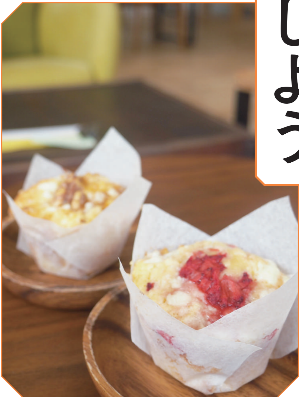
写真左／早川町「匣 (hako studio)」の店内と自家製マフィン。