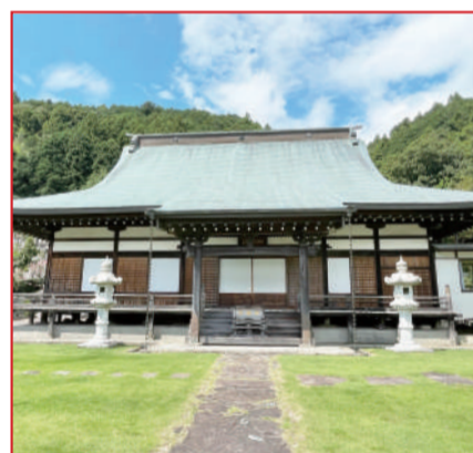
妙浄寺本堂ときれいに芝生で整えられた境内。

延寿山 妙浄寺 住所 山梨県南巨摩郡南部町南部8122 電話 05561642013 アクセス 南部ICより車で約5分