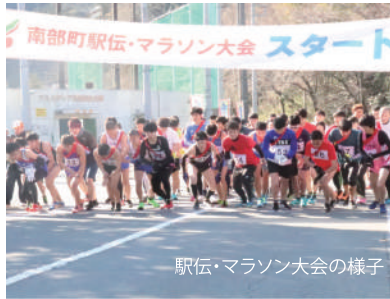
駅伝・マラソン大会の様子

南部町では毎年「南部町駅伝・マラソン大会」が開催されています(ここ数年は新型コロナウイルス感染症の為に中止)。駅伝とマラソンが別々に走るのではなく、同じ距離、同じコースを混走するという珍しい大会になっています。毎年町内外から多くの体力自慢が参加し、老若男女関係なく箱根駅伝にも負けない熱戦を繰り広げます。今年度開催されれば20回目を迎える南部町の冬の風物詩です。 ※天候や感染状況により中止になる可能性があります。