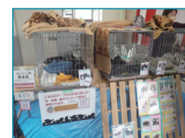
写真上/保護猫とスタッフの家での様子。写真下/譲渡会の様子。

(通称、さくらねこ)として帰した後、エサの面倒を見てもらうことを約束してもらった上で、TNRを行います。