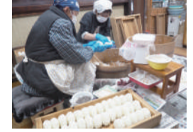
写真上/赤沢集落の様子。写真左下/左手前に福寿草と、右後ろにこれから咲こうとしているセツブンソウのつぼみ。 写真右下/江戸屋旅館で女将さんたちが御むすびを握っている様子。

ここでは宿泊に加えて、参詣客の登山弁当を作る仕事も昔から続いています。また薄暗い夜明け頃から、何升ものごはんを炊き、山型の御むすびを握るのです。現代は食料の調達が簡単になりましたが、山の道中、昔はこの自家製梅干しの大きな御むすびは、ちぎらうだったことでしょう。今でもその伝統が残っているのは貴重です。