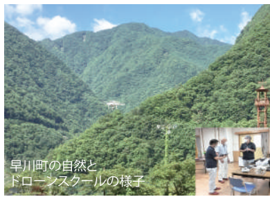
早川町の自然とドローンスクールの様子

南アルプスドローンスクール 電話番号0556-48-2621 住所 山梨県南巨摩郡大原野651 ヘルシー美里内 営業8:00~19:00 火曜定休