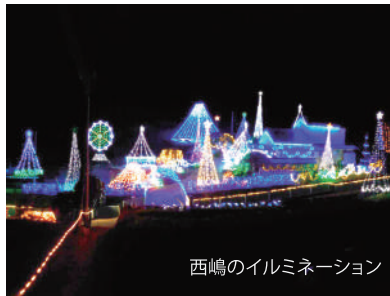
西嶋のイルミネーション

身延町の西嶋西町地区住民の皆さんによるイルミネーションが3年ぶりに開催されます。1軒のお宅から始まったイルミネーションは、地元の方の協力により今では500mの道沿いに10万個以上(推定)の灯りを点灯しています。住民の皆さん手作りによるイルミネーションロードをお楽しみください。