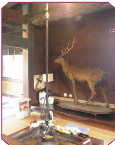
写真右/炉裏端で食べられる猪鍋や鹿刺し、ヤマメの塩焼きなどの料理。 写真中/囲炉裏と鹿の剥製が印象的な食事処の様子。 写真左/宿の入り口。猪の剥製が迫力大。

宿には天然温泉もあり、肌がすべすべになる美肌の湯と評判。体を芯まで温めてくれます。山里の雰囲気にとっぷりと浸って、リラックステキな時間を過ごしてください。