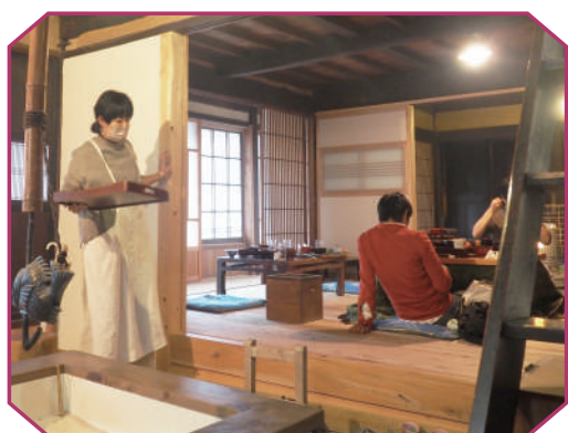
写真右/店内で販売しているkinariの木工作品。 写真中/店内の様子。 写真左/取材日にいただいた料理。