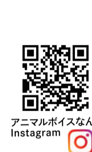
アニマルボイスなんぶ Instagram

主な活動として、「TNR」と一時保護があります。TNRとは野良猫を安全に捕獲し去勢・避妊手術をして、元の場所に返すこと。これは大変な作業で、地域の理解と協力が必要となる活動です。術後は繁殖せずこの一代だけで終わることを事前に近隣住民に説明し、「地域猫