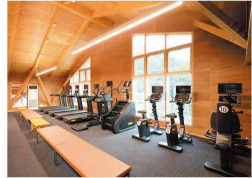
スポーツジムと、理学療法に基づいたトレーニングができる