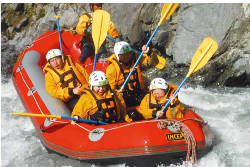
スリル満点のラフティング