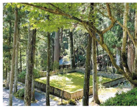
750年前に日蓮聖人が約9年間過ごした御草庵跡