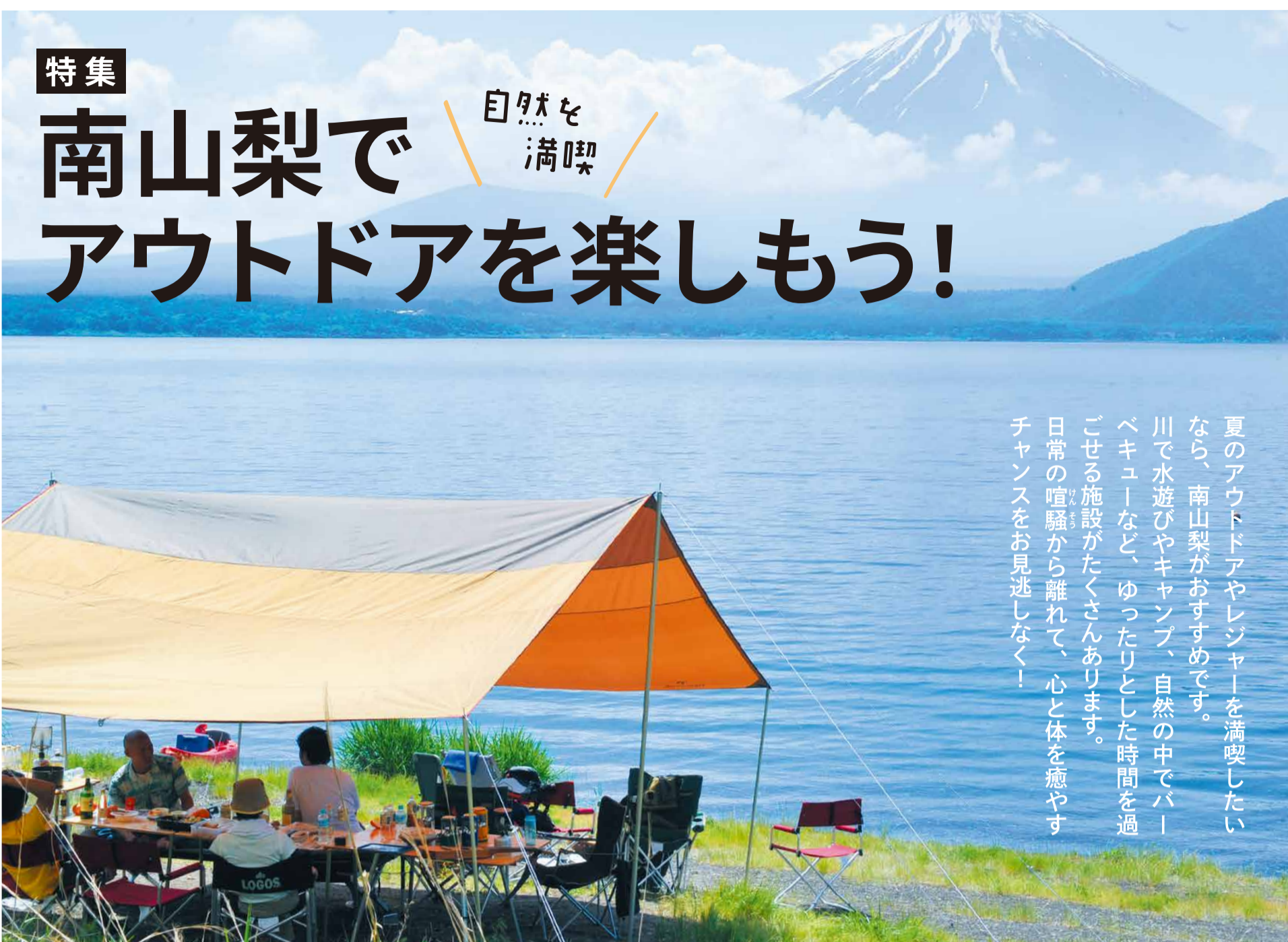
本栖湖から眺める富士山

本栖湖アクティビティセンター 〒409-3104 山梨県南巨摩郡身延町中ノ倉2926 ☎080-8746-8622 アクセス/ 中央自動車道 河口湖I.C.より約25分 中部横断自動車道 増穂I.C.より約40分 ●ご予約・お問い合わせは電話またはWebサイトをご覧ください