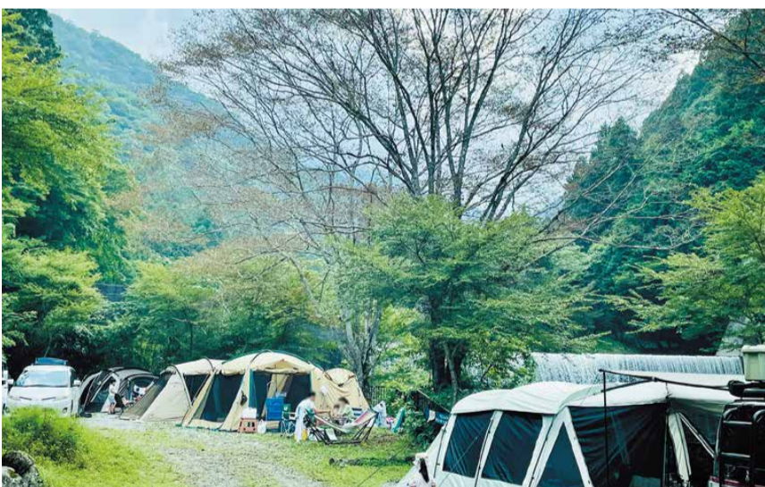
清流沿いのキャンプサイト