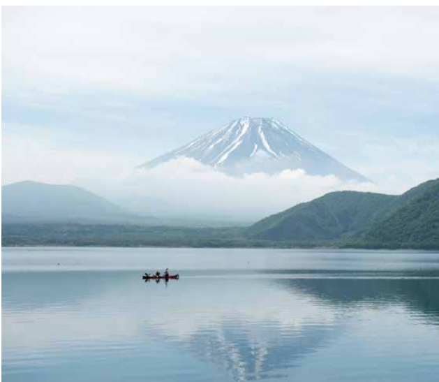
富士山を眺めながらウオーターアクティビティ