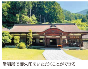
常唱殿で御朱印をいただくことができます

〒409-2524 山梨県南巨摩郡 身延町身延3628 ☎0556-62-0104(御願所法務所)