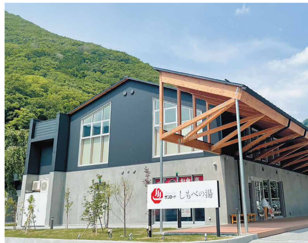
4月にオープンしたばかりの「しもべの湯」