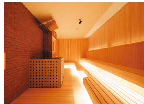
フィンランドの蒸気浴「ロウリュウ」が楽しめる大型サウナ