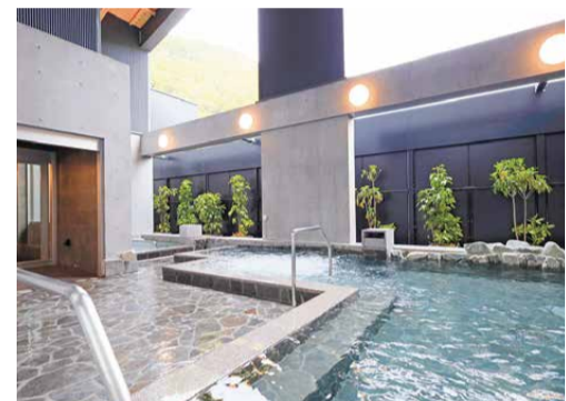
泉質の異なる2種類の源泉が楽しめる浴場内