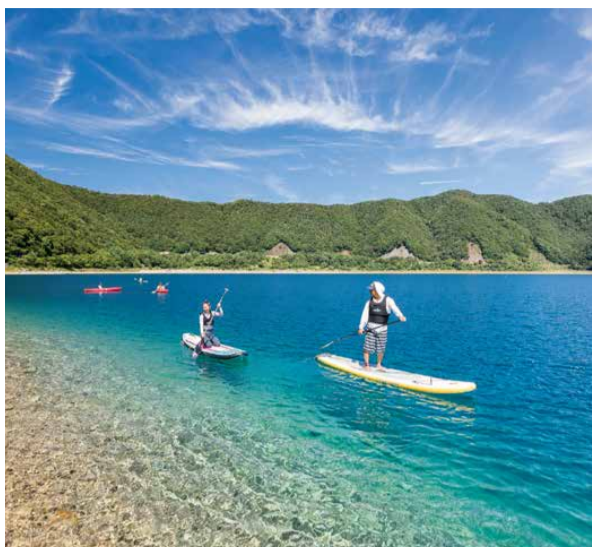
サップで水上散歩