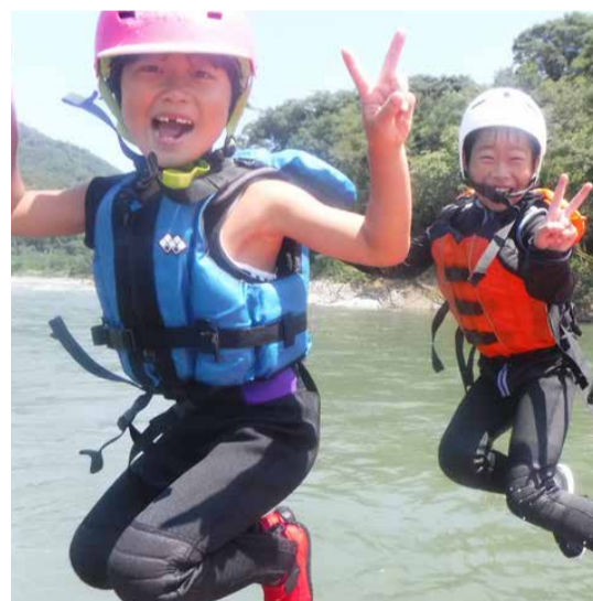
子どもも気軽に参加できます