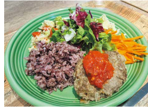
タニタカフェとコラボした3種類のヘルシープレートがある

4月28日、下部温泉駅前に「しもべの湯」がオープンしました。 ヘルシーバスサロッドが運営する身延町の施設で、健康増進をテーマとしてつくられています。館内には入浴施設の他、ジム、リラクゼーションコーナー、レストランがあります。 温泉は下部奥之湯温泉と雨河内温泉の2種類を引いており、奥之湯温泉（源泉が49・2℃のため、加水）の熱湯（あつ湯）と、雨河内温泉（源泉が20・9℃のため、加温）のぬる湯の湯船が用意されています。 下部温泉には昔から温冷浴という入浴法があり、温泉と冷泉に交互に入ることによって、交感神経と副交感神経を刺激して自律神経を整えるというものです。 しもべの湯のぬる湯は冷たすぎることのない温度にされているため、入りやすく、温かい湯船と交互にゆっくり