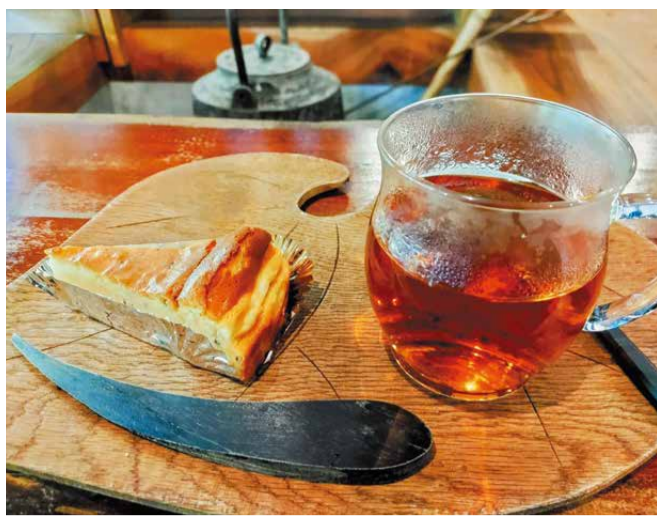
早川町産の食材を使ったケーキと紅茶

地元の猟師さんが経営するジビエ加工場から購入している、鹿肉を使った「ロースト鹿カレー」は、夏限定の人気メニューです。 地元産の大豆、麦麴、塩だけを原料