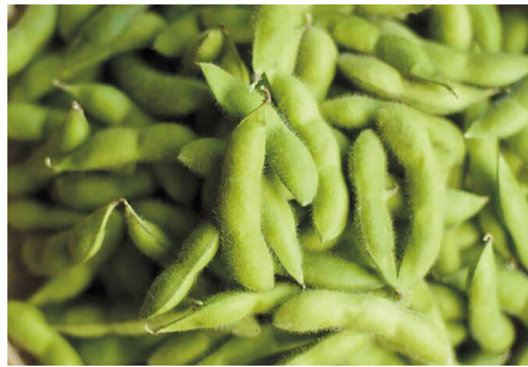
10月に枝豆の収穫、11月下旬～12月中旬に大豆の収穫と、極晩生種のあけぼの大豆。そのぶん時間をかけて成長するため、強い甘みと深みのある味に