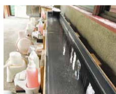
洗い場でも源泉を利用。温泉で存分に体を洗える