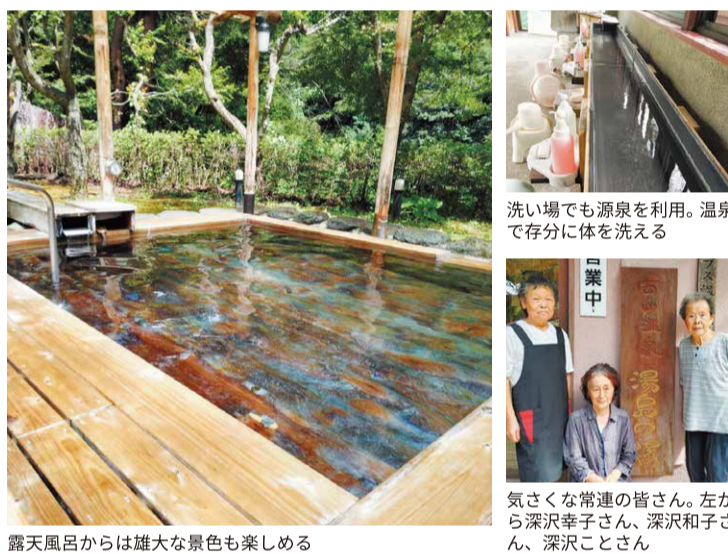
露天風呂からは雄大な景色も楽しめる