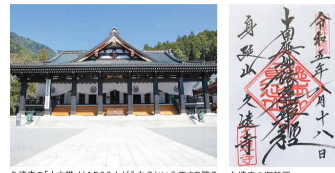
久遠寺の「大本堂」は1500人が入れるという広さを誇る