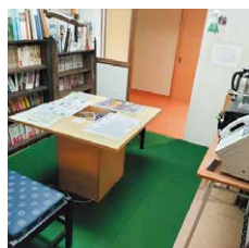
レトロな雰囲気のある休憩所