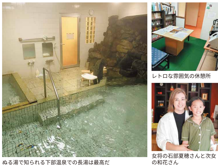
ぬる湯で知られる下部温泉での長湯は最高だ