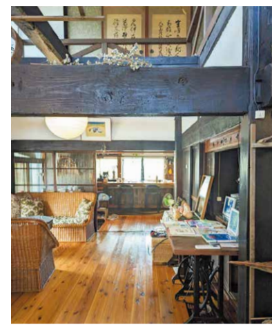
天井が高く広々とした店内